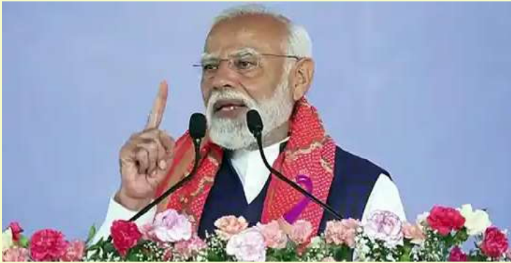
ಹೆಚ್ಚು ರೈತರಿಗೆ ಪಿಎಂ ಕಿಸಾನ್ ಸಮ್ಯಾನ್ ನಿಧಿಯ 20 ಸಾವಿರ

ತರಬೇತಿ ಪಡೆದ 30 ಸಾವಿರಕ್ಕೂ ಹೆಚ್ಚು ಮಹಿಳಾ ಸ್ವಸಹಾಯ ಗುಂಪುಗಳಿಗೆ ಪ್ರಮಾಣಪತ್ರವನ್ನೂ ವಿತರಿಸಿದರು. ಬಳಿಕ ಮಾತನಾಡಿದ ಅವರು, ಈ ಬಾರಿಯ ಲೋಕಸಭಾ ಚುನಾವಣೆಯಲ್ಲಿ ಜನರು ನೀಡಿದ ಜನಾದೇಶವು ಅಭೂತಪೂರ್ವ ಮತ್ತು ಇತಿಹಾಸ ಸೃಷ್ಟಿಸಿದೆ. ರೈತರು ಮತ್ತು ಬಡವರಿಗೆ ಸಂಬಂಧಿಸಿದ ಹೊಸ ಸರ್ಕಾರದ ಮೊದಲ ನಿರ್ಧಾರವಾಗಿ ನೆರವಿನ ಹಣವನ್ನು ಬಿಡುಗಡೆ ಮಾಡಲಾಗಿದೆ. ಕಾಶಿ ವಿಶ್ವನಾಥ, ಗಂಗಾಮಾತೆ ಮತ್ತು ಕಾಶಿಯ ಜನರ ಪ್ರೀತಿಯಿಂದ ನಾನು ಮೂರನೇ ಬಾರಿಗೆ ದೇಶದ 'ಪ್ರಧಾನ ಸೇವಕ'ನಾಗಿ ಆಯ್ಕೆಯಾಗಿದ್ದೇನೆ ಎಂದರು. ದೇಶದ 9.26 ಕೋಟಿಗೂ