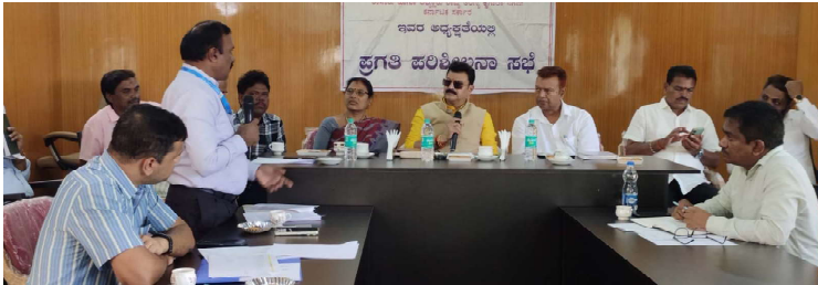
ಇದ್ದವರು ಇರಲಿ ಸುಮ್ಮನೆ ಅಲಂಕಾರಕ್ಕೆ ಇಲ್ಲಿ ವೈದ್ಯರ ಅಗತ್ಯವಿಲ್ಲ, ನಿಮ್ಮ ಜಾಗಕ್ಕೆ