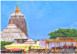
ಉತ್ಸವ) ಪ್ರಾರಂಭಿಸಿದೆ. ರತ್ನ ಭಂಡಾರದ ಕೀರ್ತಿ ಕಾಣೆಯಾಗಿರುವ ವಿಷಯ ಇತ್ತೀಚೆಗೆ ಮುಕ್ತಾಯಗೊಂಡ ಚಿನ್ನಾವಳಿಯಲ್ಲಿ ಬಹಳ

ಭುವನೇಶ್ವರ: ಪುರಿ ಜಗನ್ನಾಥ ದೇವಾಲಯದ ರತ್ನ ಭಂಡಾರವನ್ನು ಜುಲೈ 8ರಂದು ತೆರೆಯಲಾಗುವುದು ಎಂದು ಭಾರತೀಯ ಪುರಾತತ್ವ ಸರ್ವೇಕ್ಷಣಾ ಇಲಾಖೆಯ (ಎಎಸ್‌ಐ) ಹಿರಿಯ ಅಧಿಕಾರಿಯೊಬ್ಬರು ಬುಧವಾರ ತಿಳಿಸಿದ್ದಾರೆ. ಒಂಬತ್ತು ದಿನಗಳ ವಾರ್ಷಿಕ ಜಗನ್ನಾಥ ರಥೋತ್ಸವಕ್ಕೂ ಮುನ್ನ ರತ್ನ ಭಂಡಾರದ ಬಾಗಿಲುಗಳು ತೆರೆಯಲಿವೆ.