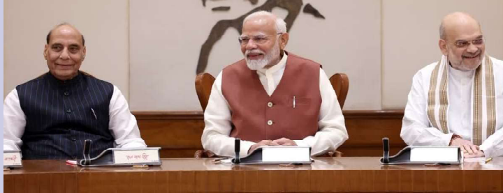
ಸರ್ಕಾರಕ್ಕೆ ಎರಡು ಲಕ್ಷ ಕೋಟಿ ರೂಪಾಯಿಗಳ ಆರ್ಥಿಕ

ಖಾರಿಫ್ ಹಂಗಾಮು ಆರಂಭವಾಗುತ್ತಿದ್ದು, ರೈತರ ಹಿತದೃಷ್ಟಿಯಿಂದ 14 ಬೆಳೆಗಳ ಎಂಎಸ್‌ಪಿಗೆ ಸಚಿವ ಸಂಪುಟ ಅನುಮೋದನೆ ನೀಡಿದೆ ಎಂದು ಸಚಿವ ಅಶ್ವಿನಿ ವೈಷ್ಣವ್ ಸಭೆಯ ನಂತರ ಪತ್ರಿಕಾಗೋಷ್ಠಿಯಲ್ಲಿ ತಿಳಿಸಿದರು. ಎಂಎಸ್‌ಪಿಯಿಂದ