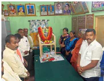
ಮಾಲೂರು: ತೊರ್ಮೆಹಳ್ಳಿ ಗ್ರಾ.ಪಂ.ಕಚೇರಿಯಲ್ಲಿ ನಾಡಪ್ರಭು ಕೆಂಪೇಗೌಡರ 515ನೇ ಜಯಂತಿ ಅಂಗವಾಗಿ ಕೆಂಪೇಗೌಡ ಭಾವಚಿತ್ರಕ್ಕೆ ಮಾಲಾರ್ಪಣೆ ಮಾಡಿ ಪೂಜೆಯನ್ನು ಸಲ್ಲಿಸಿ ಅದ್ದೂರಿಯಾಗಿ ಆಚರಣೆ ಮಾಡಲಾಯಿತು.