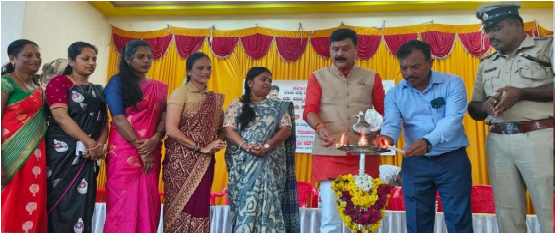
ಹೊಸನಗರ: ಕೊರೋನ ಕಾಲದಲ್ಲಿ ಸೈನಿಕರಂತೆ ದೈನಂದಿನ ಆತ್ಮತುಂಬಾ ಸೇವೆ ಸಲ್ಲಿಸಿದ ಅಂಗನವಾಡಿ ಕಾರ್ಯಕರ್ತರ ಸೇವೆಯನ್ನು