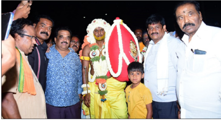
ಸುತ್ತಣ ಪರಿಸರಕ್ಕೆ ಧಾರ್ಮಿಕತೆಯ ಆವರಣವನ್ನು ಹೊದಿಸಿತ್ತು.

ಕರಗವನ್ನು ಕಂಕುಳಲ್ಲಿ ಹೊತ್ತ ಪೂಜಾರಿ ಧರ್ಮರಾಯ ತಮಟೆಯ ನಾದಕ್ಕೆ ತಕ್ಕಂತೆ ಹೆಜ್ಜೆ ಹಾಕುತ್ತಾ ಸಾಗುತ್ತಿದ್ದರೆ, ವೀರಗಾರರ ಗೋವಿಂದ ನಾಮಸ್ಮರಣೆ