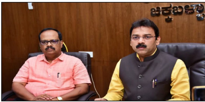
ಯಾವುದೇ ಮಧ್ಯದಂಗಡಿ, ಹೋಟೆಲ್ ಮಾರಾಟ/ವಿತರಣೆ ಮಾಡುವ ಇತರೆ ರೆಸ್ಟೋರಂಟ್, ಕ್ಲಬ್ ಗಳು, ಮಧ್ಯ ಎಷ್ಟಾಬ್ಲಿಷ್ ಮೆಂಟ್ ಗಳು ಸೂಚಿಸಲಾಗಿರುವ

ಯಾವುದೇ ಹಣ, ಉಡುಗೊರೆ ಅಥವಾ ಸುವ್ಯವಸ್ಥೆಗಳ ಸಮಸ್ಯೆಗಳನ್ನು ತಡೆಗಟ್ಟುವ ಉದ್ದೇಶದಿಂದ ಚುನಾವಣಾ ದಿನದಂದು ಅಭ್ಯರ್ಥಿಗಳು ಚುನಾವಣೆಗಾಗಿ ಅನುಮತಿ ಪಡೆದುಕೊಂಡಿರುವ ವಾಹನಗಳನ್ನು ಮಾತ್ರ ಬಳಕೆ ಮಾಡಬೇಕು. ಹಣ, ಉಡುಗೊರೆ, ಮಧ್ಯ ವಿತರಣೆಯನ್ನು ತಪ್ಪಿಸುವ ಸಲುವಾಗಿ ಎಲ್ಲಾ ಖಾಸಗಿ ವಾಹನಗಳನ್ನು ನಿಯಮಾನುಸಾರ ಪರಿಶೀಲಿಸಲಾಗುತ್ತದೆ.