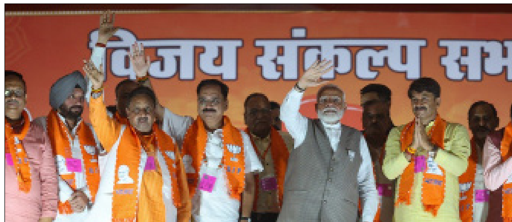
ದೆಹಲಿಯಲ್ಲಿ ಅಯೋಜಿಸಿದ್ದ ಭೂತ್ ಪ್ರಚಾರ ಸಮಾವೇಶದಲ್ಲಿ ಪ್ರಧಾನಮಂತ್ರಿ ನರೇಂದ್ರ ಮೋದಿ ಅವರು ಜಿಜಿಪಿ ಪರ ಮತಯಾಚಿಸಿದರು.