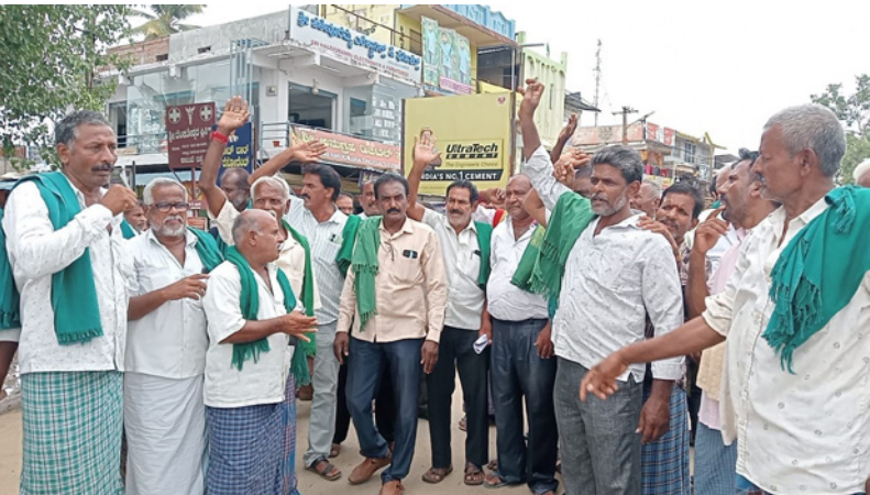
ಮಂಡ್ಯ ಜಿಲ್ಲೆಯನ್ನು ಸಕ್ರಮಿಸುತ್ತಿರುವ ಬರದಿಂದಾಗಿ ರೈತರ ಹಣಕಾಸು ನಷ್ಟವಾಗುತ್ತಿದೆ. ಪ್ರಸ್ತುತ ಮಂಡ್ಯ ಜಿಲ್ಲೆಗೆ ಭೀಕರ ಬರಗಾಲ ಬಂದಿರುವುದರಿಂದ, ಕಾವೇರಿ ಅಚ್ಚುಕಟ್ಟು ಪ್ರದೇಶದ ರೈತರು ತಾವು ಬೆಳೆದ ಬೆಳೆಗಳಿಂದ ನಷ್ಟ ಮಾಡಿಕೊಂಡು ವೇದನಿಸುತ್ತಿದ್ದಾರೆ ಎಂದು ಬೇಸರ ವ್ಯಕ್ತಪಡಿಸಿದರು.